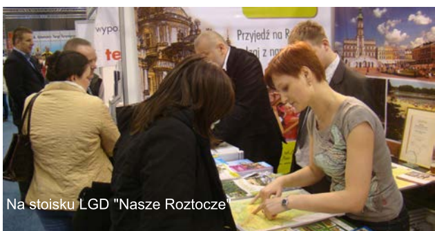
Na stoisku LGD "Nasze Roztocze"

Stoisko LGD „Nasze Roztocze” zostało przygotowane we współpracy z Lokalną Organizacją Turystyczną Zamość i Roztocze oraz Biurem Turystycznym QUAND. Było to jedyne stoisko wystawiennicze z terenu Lubelszczyzny, stąd cieszyło się dużym zainteresowaniem odwiedzających targi.