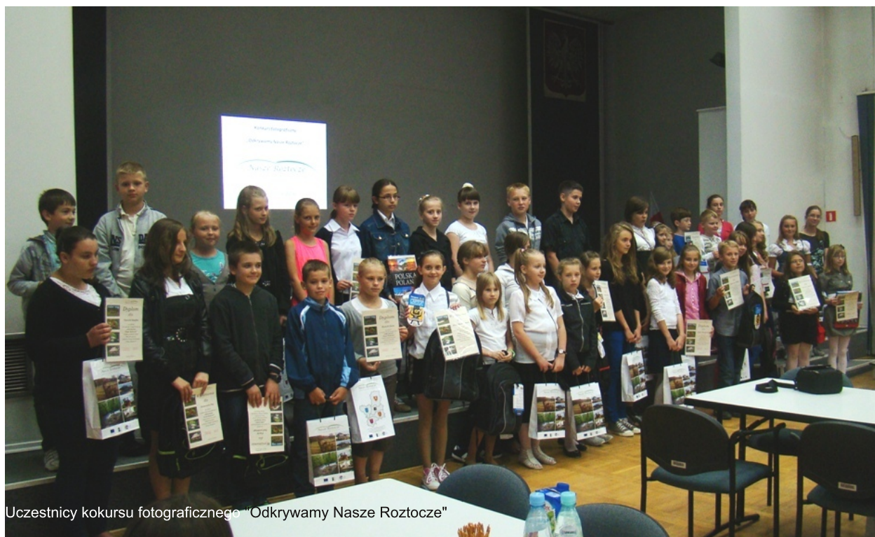
Uczestnicy konkursu fotograficznego „Odkrywamy Nasze Roztocze”