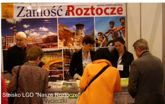
Stoisko LGD "Nasze Roztocze"

W bieżącym roku targi zgromadziły ponad 200 wystawców z kraju i z zagranicy oraz 10 tysięcy osób odwiedzających, które miały możliwość zapoznania się z ofertą turystyczną poszczególnych regionów, gospodarstw agroturystycznych, biur podróży oraz obiektów noclegowych.