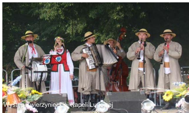
Występ Zwierzynieckiej Kapeli Ludowej

Bardzo dużym zainteresowaniem odwiedzających targi cieszyły się zorganizowane na stoisku LGD warsztaty kulinarne, podczas których przygotowano pierogi z kaszą gryczaną i serem, pierogi ruskie oraz zapalankę kartoflaną na boczku. Dorobek kulturalny obszaru LGD na scenie prezentowała Zwierzyniecka Kapela Ludowa.