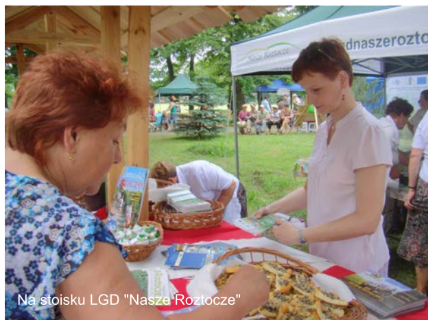
Na stoisku LGD "Nasze Roztocze"

W drugim dniu targów odbyły się występy zespołów artystycznych, konkursy i pokazy. Na stoiskach promocyjnych prezentowano oferty turystyki wiejskiej, tradycyjnego rękodzieła ludowego oraz produkty kuchni regionalnej. Na stoisku LGD „Nasze Roztocze” prezentowane były ekspozyty z Regionalnej Izby Pamięci w Wysokiem oraz kwiaty z bibuły wykonane przez panie z Koła Gospodyń Wiejskich w Wysokiem. Można było także otrzymać materiały promocyjne i informacyjne — mapy, foldery, informatory turystyczne, przewodniki i ulotki promujące ofertę turystyczną Roztocza. Dla odwiedzających stoisko przygotowano roztoczańskie przysmaki — cebularze oraz pierożki drożdżowe z kaszą gryczaną i serem.