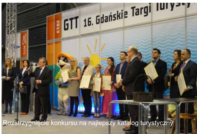
Rozstrzygnięcie konkursu na najlepszy katalog turystyczny

Na stoisku LGD można było otrzymać materiały promocyjne i informacyjne — mapy, foldery, informatory turystyczne, przewodniki i ulotki promujące ofertę turystyczną Roztocza. Dużym zainteresowaniem wśród turystów cieszyła się propozycja aktywnego wypoczynku na Zamojszczyźnie i Roztoczu. Turyści pytali o szlaki rowerowe, spływy kajakowe, ofertę wypoczynku nad wodą oraz bazę noclegową na Roztoczu. Prezentowany na stoisku LGD folder Magiczne Roztocze otrzymał Medal Mercurius Gedanensis za najlepszy katalog turystyczny na targach.