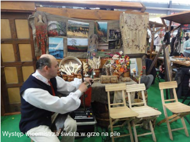
Występ wicemistrza świata w grze na pile

Region lubelski reprezentowany był przez cztery Lokalne Grupy Działania — „Lepsze Jutro”, „Nasze Roztocze”, „Jagiellońska Przystań” i „LGD Ziemi Kraśnickiej”. Ponadto swoją ofertę prezentowały również „Zagroda Guciów”, „Uroczysko Zaborek”, „Nadwieprzańska Strefa Przygody”, „Wioska Gotów” z Masłomęcza, „Kraina Rumianku” i „Zagroda Roztocze”. Na stoisku zaprezentowane zostały także produkty sieciowe – „Szlak Żelaza i Kowalskich Tradycji” z Wojciechowa oraz „Lubelskie w siodle”.