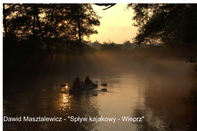
Dawid Masztalewicz - "Spływ kajakowy - Wieprz"