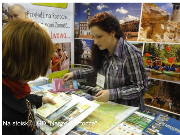
Na stoisku LGD "Nasze Roztocze"

Na stoisku LGD można było otrzymać materiały promocyjne i informacyjne — mapy, foldery, informatory turystyczne, przewodniki i ulotki promujące ofertę turystyczną Roztocza. Dużym zainteresowaniem wśród turystów cieszyła się propozycja aktywnego wypoczynku na Zamojszczyźnie i Roztoczu. Turyści pytali o szlaki rowerowe, spływy kajakowe, ofertę wypoczynku nad wodą oraz bazę noclegową na Roztoczu. Prezentowany na stoisku LGD folder Magiczne Roztocze otrzymał Medal Mercurius Gedanensis za najlepszy katalog turystyczny na targach.