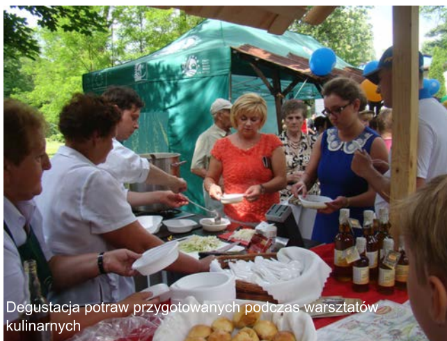
Degustacja potraw przygotowanych podczas warsztatów kulinarnych

Bardzo dużym zainteresowaniem odwiedzających targi cieszyły się zorganizowane na stoisku LGD warsztaty kulinarne, podczas których przygotowano pierogi z kaszą gryczaną i serem, pierogi ruskie oraz zapalankę kartoflaną na boczku. Dorobek kulturalny obszaru LGD na scenie prezentowała Zwierzyniecka Kapela Ludowa.