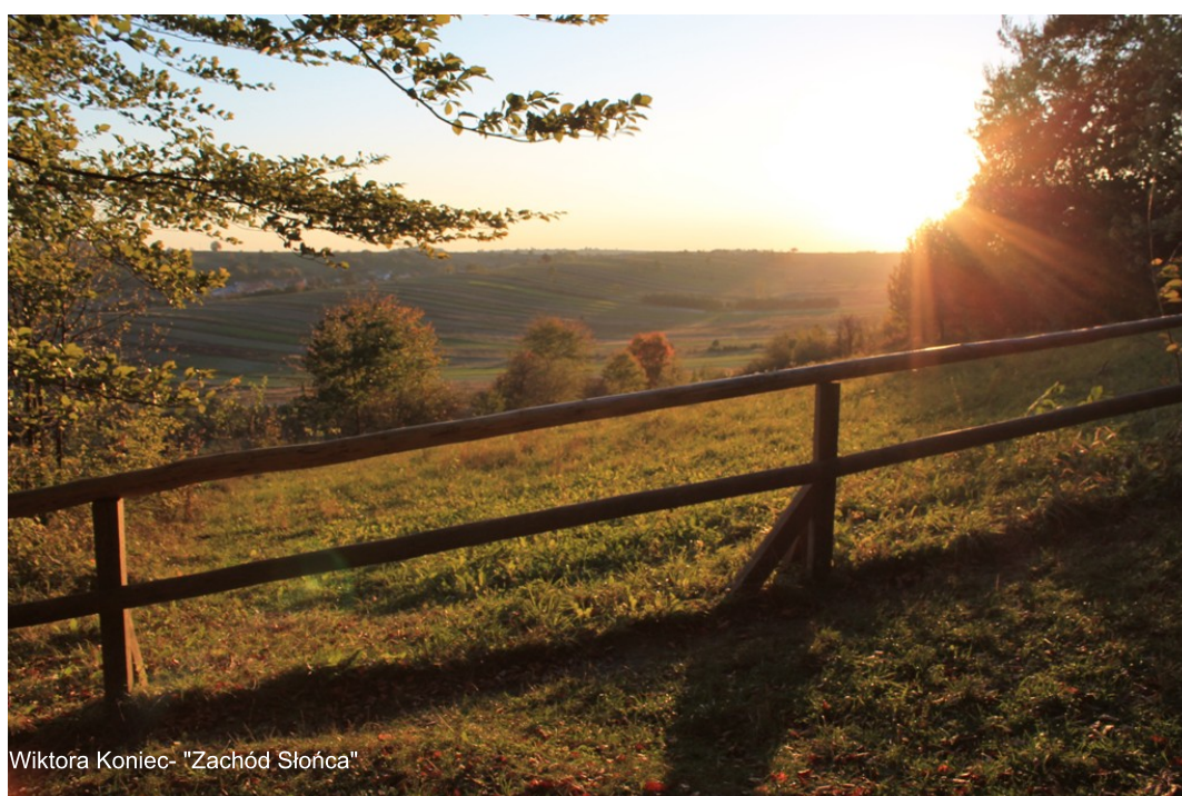
Wiktora Koniec- "Zachód Słońca"