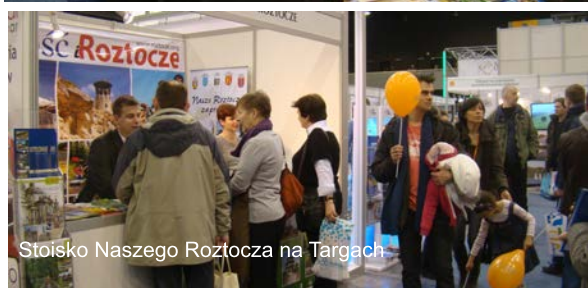
Stoisko Naszego Roztocza na Targach