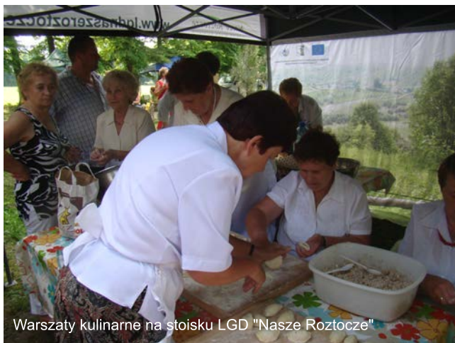
Warsztaty kulinarne na stoisku LGD "Nasze Roztocze"