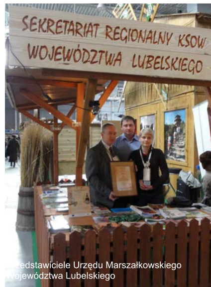
Przedstawiciele Urzędu Marszałkowskiego Województwa Lubelskiego

Roztoczańskie pejzaże, skamieniałości, własnoręcznie wykonana biżuteria, drewniane misy, to tylko niektóre elementy prezentowane na stoisku wystawienniczym LGD „Nasze Roztocze”. Stoisko zostało przygotowane we współpracy z właścicielami „Zagrody Guciów”, którzy zachęcali do zapoznania się z bogatą ofertą Zagrody, smaczną roztoczańską kuchnią oraz ciekawostkami archeologicznymi z obszaru LGD „Nasze Roztocze”. Zainteresowaniem turystów cieszyła się również prezentowana przez przedstawiciela LGD propozycja aktywnego wypoczynku. Turyści pytali o szlaki rowerowe, spływy kajakowe i ofertę wypoczynku nad wodą. Na stoisku można było otrzymać materiały promocyjne i informacyjne przygotowane przez LGD „Nasze Roztocze” — mapy, informatory turystyczne, przewodniki i ulotki promujące ofertę turystyczną Roztocza.