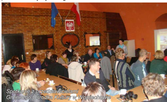
Spotkanie z przedstawicielami Gminnego Ośrodka Kultury w Wojciechowie

W dniu 22 listopada 2012r. grupa lokalnych liderów z obszaru LGD „ Nasze Roztocze ” uczestniczyła w wyjeździe studyjno-szkoleniowym na „ Szlak żelaza i kowalskich tradycji do Wojciechowa ”. W wyjeździe udział wzięli przewodnicy po Roztoczu, właściciele atrakcji turystycznych i gospodarstw agroturystycznych oraz osoby zainteresowane rozpoczęciem działalności agroturystycznej na obszarze LGD „ Nasze Roztocze ”. Celem wyjazdu była prezentacja dobrych praktyk w zakresie współpracy właścicieli atrakcji turystycznych a także zasad tworzenia i funkcjonowania sieciowego produktu turystycznego.