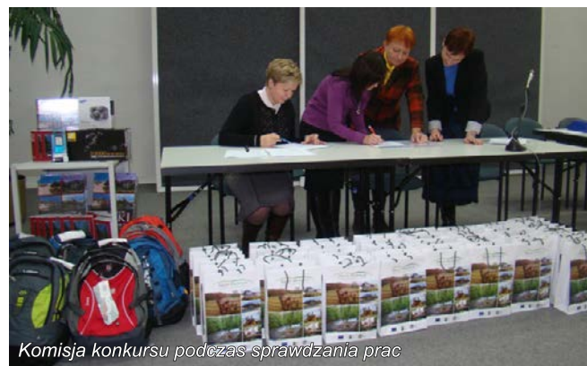
Komisja konkursu podczas sprawdzania prac

wiedzy o Lokalnej Grupie Działania „ Nasze Roztocze ” i obszarze objętym Lokalną Strategią Rozwoju. Celem konkursu było upowszechnianie wiedzy o działaniach prowadzonych przez LGD, promocja obszaru objętego Lokalną Strategią Rozwoju, zainteresowanie uczniów szkół gimnazjalnych historią regionu i jego zabytkami oraz inspirowanie w odkrywaniu ciekawych miejsc pod względem przyrodniczym, historycznym i krajobrazowym. Do walki o atrakcyjne nagrody przystąpiło 33 uczniów, którzy mieli za zadanie rozwiązać test składający się