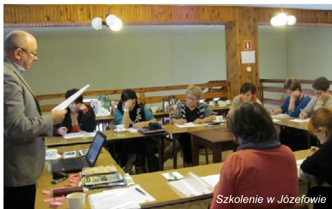
Szkolenie w Józefowie

W szkoleniach uczestniczyło łącznie ponad 60 osób prowadzących lub planujących rozpoczęcie działalności agroturystycznej na obszarze LGD „Nasze Roztocze”. Przekazana podczas spotkań wiedza teoretyczna została uzupełniona licznymi przykładami i dobrymi praktykami, dzięki czemu uczestnicy uzyskali najbardziej aktualne i rzetelne informacje. Będą one z pewnością przydatne w planowanej lub prowadzonej działalności agroturystycznej, szczególnie że zostały przekazane przez osobę zajmującą się oceną standardu usług oferowanych przez gospodarstwa agroturystyczne.