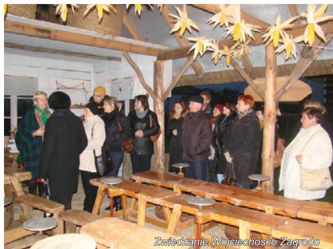
Zwiedzanie Wojciechosko Zagrodo

Ostatnim punktem wyjazdu była wizyta w Wojciechosko Zagrodzie, gdzie funkcjonuje mini skansen, w którym możemy zobaczyć jak kiedyś wyglądało życie na wsi. W Zagrodzie znajduje się także Chata Kowala oraz w pełni wyposażona,