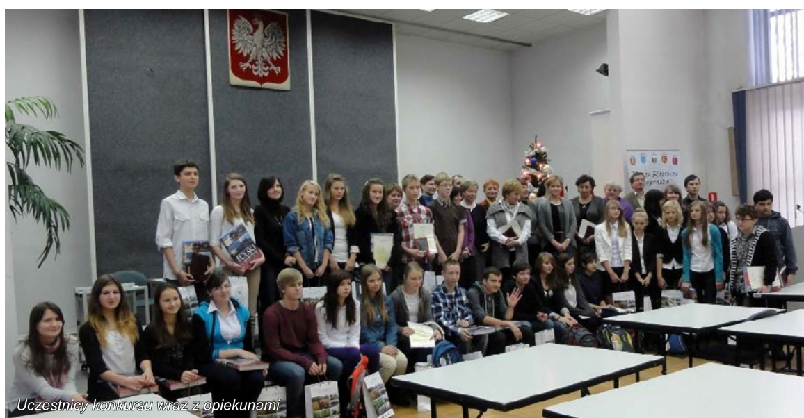
Uczestnicy konkursu wraz z opiekunami

Wszystkim uczestnikom dziękujemy za udział w konkursie i życzymy dalszych sukcesów w zdobywaniu nowej wiedzy.