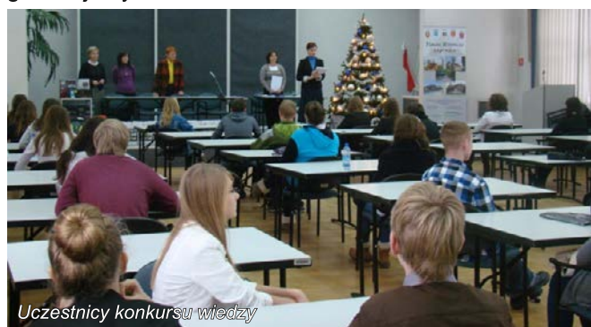
Uczestnicy konkursu wiedzy

W listopadzie 2012r. Stowarzyszenie ogłosiło konkurs wiedzy o Lokalnej Grupie Działania „ Nasze Roztocze ” i obszarze objętym Lokalną Strategią Rozwoju. Konkurs skierowany był do młodzieży ze szkół gimnazjalnych zamieszkałych na terenie LGD. Ogłoszony konkurs spotkał się z dużym zainteresowaniem. Do udziału w konkursie zgłoszonych zostało 33 uczestników ze wszystkich szkół gimnazjalnych z terenu LGD.