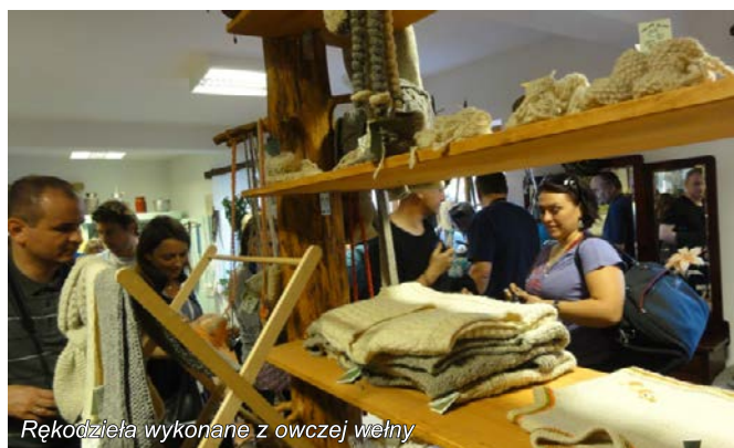
Rękodzieła wykonane z owczej wełny

W dniach 21 — 26 października 2012r. przedstawiciele Lokalnych Grup Działania z województwa lubelskiego uczestniczyli w wyjeździe studyjno-szkoleniowym do Słowenii. Celem zorganizowanego przez Sekretariat Regionalny KSOW Województwa Lubelskiego wyjazdu, było poznanie przykładów dobrych praktyk w zakresie wdrażania lokalnych strategii rozwoju i zasad