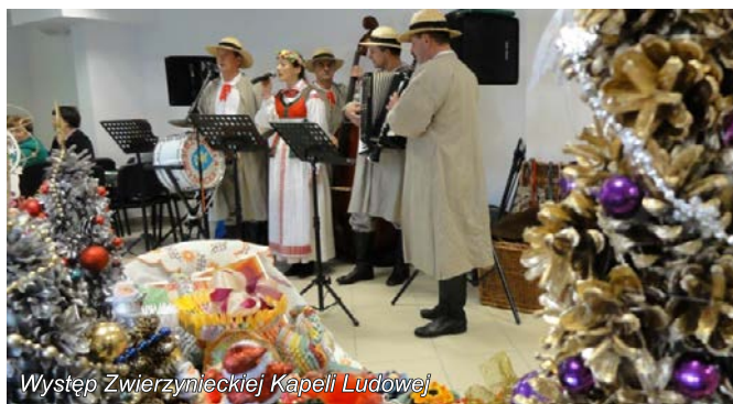
Występ Zwierzynieckiej Kapeli Ludowej

Uczestnicy konferencji wysłuchali występu Zwierzynieckiej Kapeli Ludowej , która wystąpiła w strojach zakupionych przy pomocy dofinansowania w ramach wdrażania Lokalnej Strategii Rozwoju LGD „ Nasze Roztocze ”. Stowarzyszenie „Radość i nadzieja” z Dominikanówki w gminie Krasnobród zaprezentowało stroiki świąteczne, anioły z masy solnej oraz wyroby z ceramiki, do wypalania których zakupiony zostanie profesjonalny piec w ramach małego projektu „Spotkanie z ceramiką” dofinansowanego ze środków przeznaczonych na wdrażanie LSR LGD „ Nasze Roztocze ”. Zainteresowaniem uczestników konferencji cieszyły się także eksponaty z Regionalnej