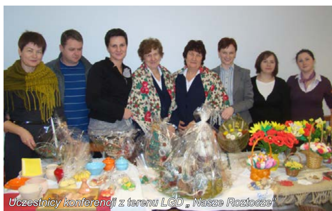
Uczestnicy konferencji z terenu LGD „ Nasze Roztocze ”

Izby Pamięci oraz kwiaty z bibuły, które prezentowały panie z Koła Gospodyń Wiejskich w Wysokiem . Nowy, okazały budynek Regionalnej Izby Pamięci w Wysokiem, w którym zgromadzono eksponaty nawiązujące do dawnego życia na wsi i pracy rolników, został wybudowany także dzięki dofinansowaniu z PROW 2007–2013 w ramach działania „Odnowa i rozwój wsi”. Uczestnictwo w konferencji było dobrą okazją do promocji obszaru i działalności LGD „ Nasze Roztocze ” oraz projektów, które zostały zrealizowane dzięki wsparciu z PROW.