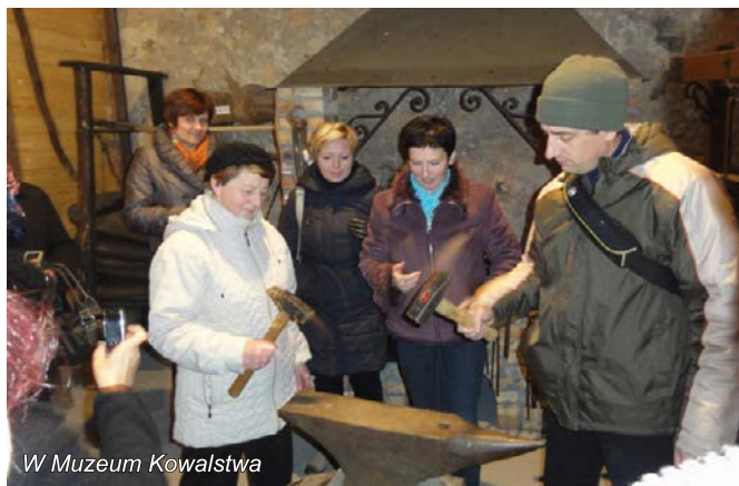
W Muzeum Kowalstwa

Pierwszym punktem wizyty było spotkanie z przedstawicielami Gminnego Ośrodka Kultury w Wojciechowie, którzy opowiedzieli o procesie powstawania „Szlaku żelaza i kowalskich tradycji” oraz jego bieżącym funkcjonowaniu i inicjatywach podejmowanych przez podmioty tworzące szlak. Następnie zaprezentowane zostały: Muzeum Kowalstwa mieszczące się w Wieży Ariańskiej, gdzie zgromadzone są prace wykonane przez