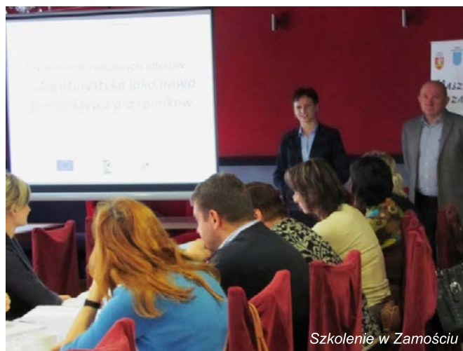
Szkolenie w Zamościu