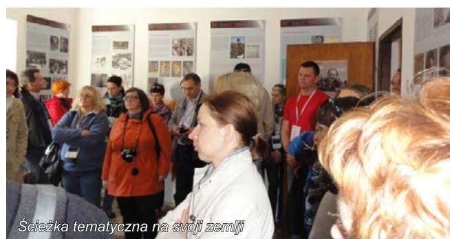
Ścieżka tematyczna na swojej ziemi

funkcjonowania lokalnych grup działania na Słowenii. W ramach wyjazdu uczestnicy zapoznali się z działalnością trzech Lokalnych Grup Działania LAS za rozwój, LAS Jugozahodnega de la Severne Primorske oraz LAS BSC Kranj a także projektami zrealizowanymi w ramach programu Leader. Pierwszym projektem, który mogliśmy zobaczyć była ścieżka tematyczna „Na svoji zemlji” dokumentująca prace nad pierwszym słoweńskim filmem.