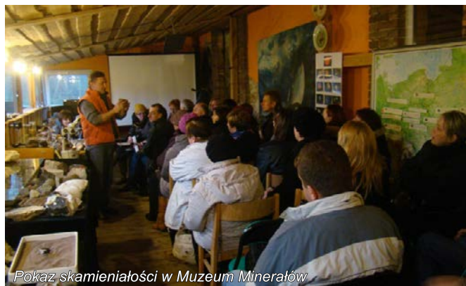
Pokaz skamieniałości w Muzeum Mineralów