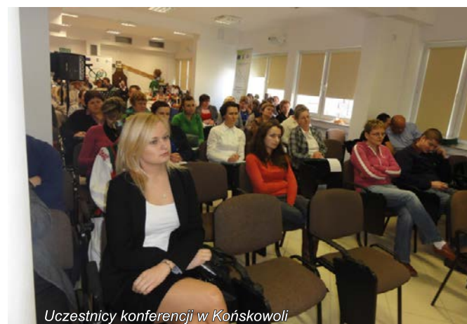
Uczestnicy konferencji w Końskowoli

W dniu 06.12.2012r. LGD „Nasze Roztocze” uczestniczyło w konferencji dotyczącej realizacji Programu Rozwoju Obszarów Wiejskich, którą na zlecenie Ministerstwa Rolnictwa i Rozwoju Wsi zorganizował Lubelski Ośrodek Doradztwa Rolniczego w Końskowoli. Podczas konferencji zaprezentowano dorobek kulturalny polskiej wsi oraz jej rozwój wspierany środkami finansowymi pochodzącymi z PROW na lata 2007 – 2013.