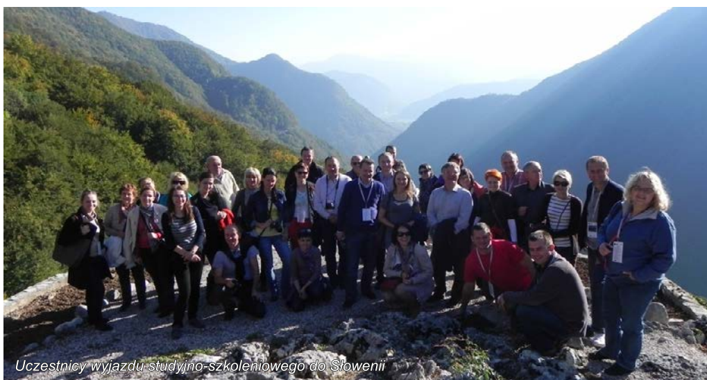
Uczestnicy wyjazdu studyjno-szkoleniowego do Słowenii

Następnie odwiedziliśmy sklep „Od owcy do produktu”, w którym można było zakupić rękodzieła wytwarzane z owczej wełny przez mieszkańców okolic miasta Bovec. W programie wyjazdu znalazła się także degustacja tradycyjnych słoweńskich potraw. Jednak najbardziej interesującym pomysłem zrealizowanym z dofinansowaniem ze środków Leader, który mieliśmy okazję zobaczyć w Słowenii, było utworzenie Centrum Pszczelarstwa wraz z zakupem linii technologicznej, z której korzystają właściciele pasiek skupieni w spółdzielni pszczelarskiej. Jest to pomysł, który warto zaprezentować pszczelarzom z obszaru Naszego Roztocza i okolic.