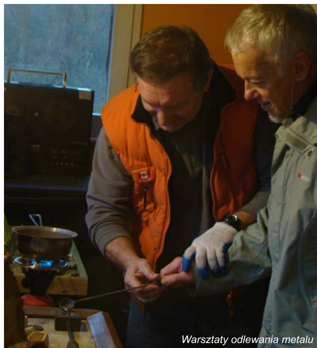
Warsztaty odlewania metalu

sposób opowiedział o swojej pracy oraz zaprezentował proces kucia żelaza na gorąco. Następnie uczestnicy wyjazdu zwiedzili Muzeum Mineralów mieszczące się w Młynie Hipolit oraz uczestniczyli w warsztatach wytapiania i odlewania metali w piecu-dymarce. Każdy uczestnik mógł samodzielnie wylać pamiątkową monetę lub podkowę.