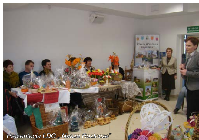
Prezentacja LDG „Nasze Roztocze”

W ramach dobrych praktyk zaprezentowano projekty, które zostały zrealizowane na obszarze trzech Lokalnych Grup Działania z województwa lubelskiego – LGD „Polesie”, LGD „Zielony Pierścień” oraz LGD „Nasze Roztocze”.