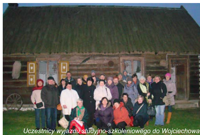
Uczestnicy wyjazdu studyjno-szkoleniowego do Wojciechowa

oryginalna drewniana kuźnia. Uczestnictwo w wyjeździe studyjno – szkoleniowym było szansą zdobycia wiedzy praktycznej dotyczącej tworzenia i funkcjonowania sieciowych produktów turystycznych. Mamy nadzieję, że przyczyni się ona do rozwoju takich produktów na obszarze LGD „Nasze Roztocze”.