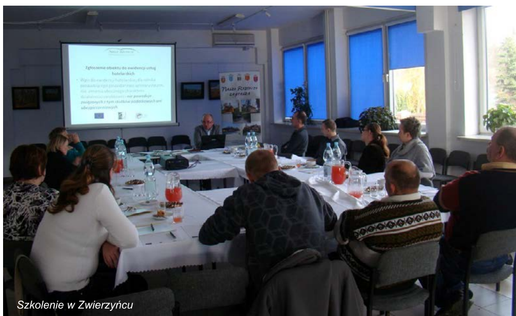
Szkolenie w Zwierzyncu

W szkoleniach uczestniczyło łącznie ponad 60 osób prowadzących lub planujących rozpoczęcie działalności agroturystycznej na obszarze LGD „Nasze Roztocze”. Przekazana podczas spotkań wiedza teoretyczna została uzupełniona licznymi przykładami i dobrymi praktykami, dzięki czemu uczestnicy uzyskali najbardziej aktualne i rzetelne informacje. Będą one z pewnością przydatne w planowanej lub prowadzonej działalności agroturystycznej, szczególnie że zostały przekazane przez osobę zajmującą się oceną standardu usług oferowanych przez gospodarstwa agroturystyczne.