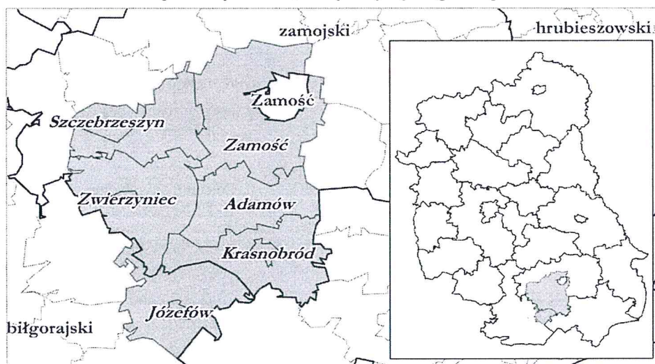
Ryc. Obszar LGD „Nasze Roztocze” – granice gmin

LGD „Nasze Roztocze” jest położone w południowej części województwa lubelskiego.