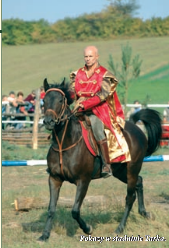
Pokazy w stadninie Tarka.