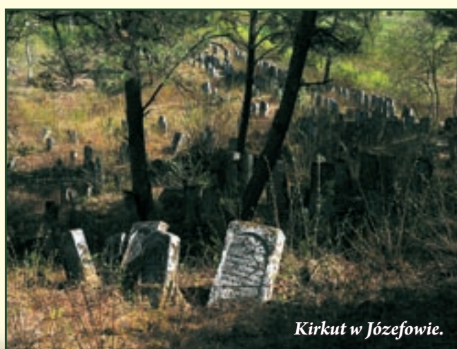
Kirkut w Józefowie.