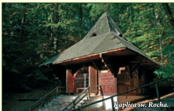
Kaplica św. Rocha.