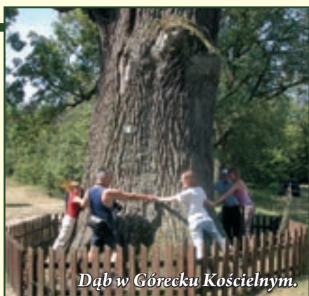
Dąb w Górecku Kościelnym.