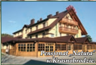
Pensjonat „Natura” w Krasnobrodzie.