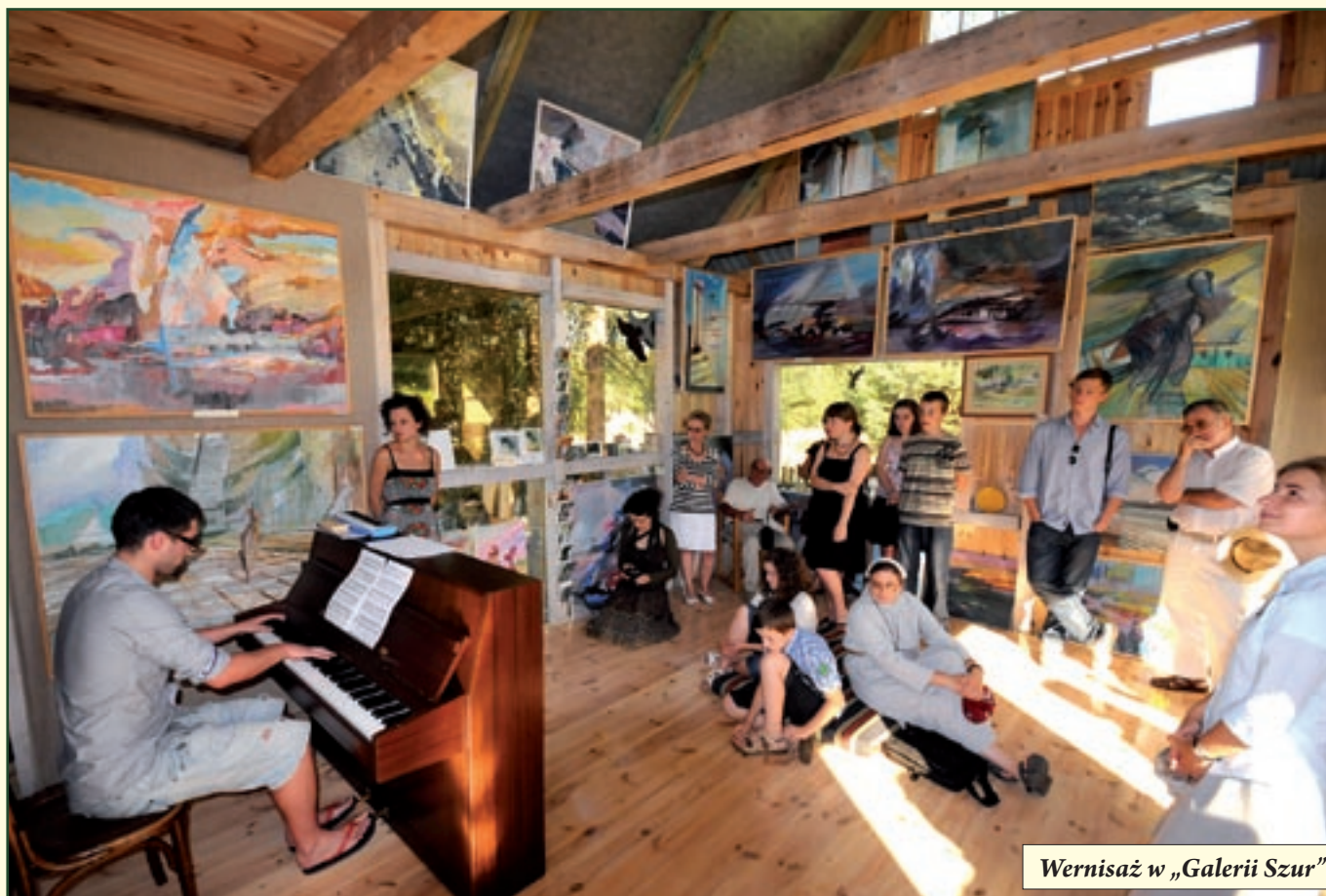
Wernisaż w „Galerii Szur”.