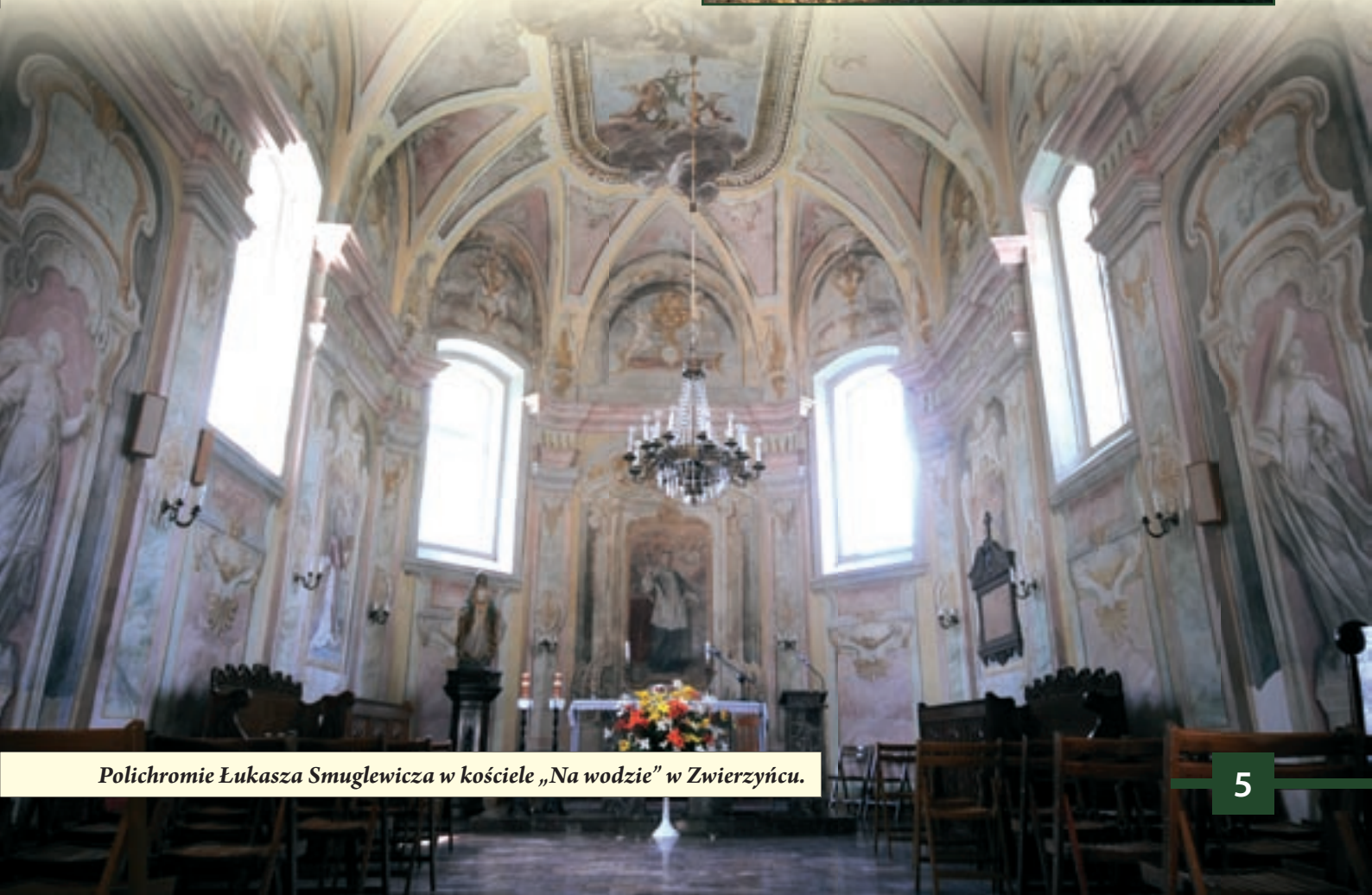
Polichromie Łukasza Smuglewicza w kościele „Na wodzie” w Zwierzyńcu.