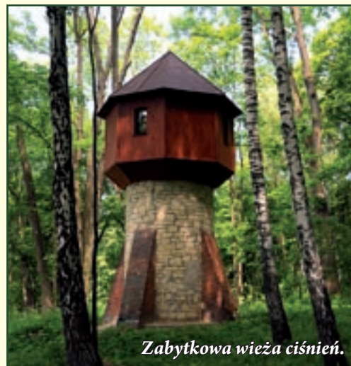
Zabytkowa wieża ciśnię.