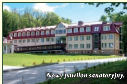
Nowy pawilon sanatoryjny.