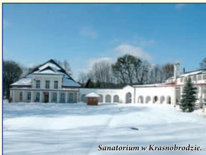
Sanatorium w Krasnobrodzie.