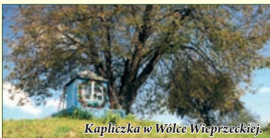
Kapliczka w Wólce Wieprzeckiej.

N ajstarsze ślady człowieka na Roztoczu pochodzą z neolitu (ok. 2000-4500 lat p.n.e.). Duży napływ osadników, głównie z Mazowsza, miał miejsce na przełomie XIV i XV wieku i wiązał się z działalnością Siemowita IV. Jednak najważniejszą postacią dla rozwoju Roztocza był kanclerz i hetman wielki koronny Jan Zamoyski. W 1589 r. utworzył on Ordynację Zamojską, która obejmowała zasięgiem większość Roztocza. Kolejni ordynacyjni zakładali miasta i wsie, tworzyli zakłady przemysłowe, modernizowali rolnictwo i prowadzili wzorową gospodarkę leśną. Ordynacja przetrwała do 1944 r.