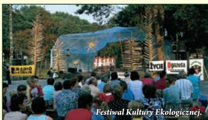
Festiwal Kultury Ekologicznej.

Wypoczywając na Roztoczu, warto odwiedzić posiadające ciekawe zbiory muzea i izby pamięci. W większości z nich, m.in. w Guciowie, Górecku Kościelnym, Krasnobrodzie, Wysokiem k. Zamościa i Zwierzyńcu przy ZOKiR, dominują zbiory etnograficzne. Muzeum w Bondyrzu poświęcone jest przede wszystkim II wojnie światowej, Muzeum Sakralne w Krasnobrodzie historii sanktuarium NMP, a ekspozycja Ośrodka Edukacyjno-Muzealnego Roztoczańskiego Parku Narodowego przyrodzie parku i Roztocza.