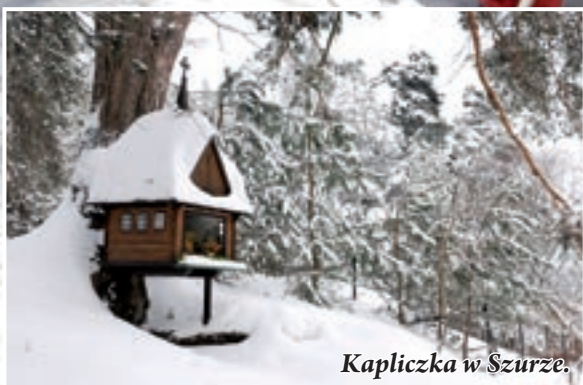
Kapliczka w Szurze.