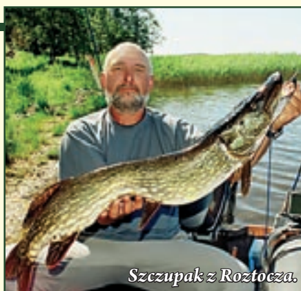
Szczupak z Roztocza.