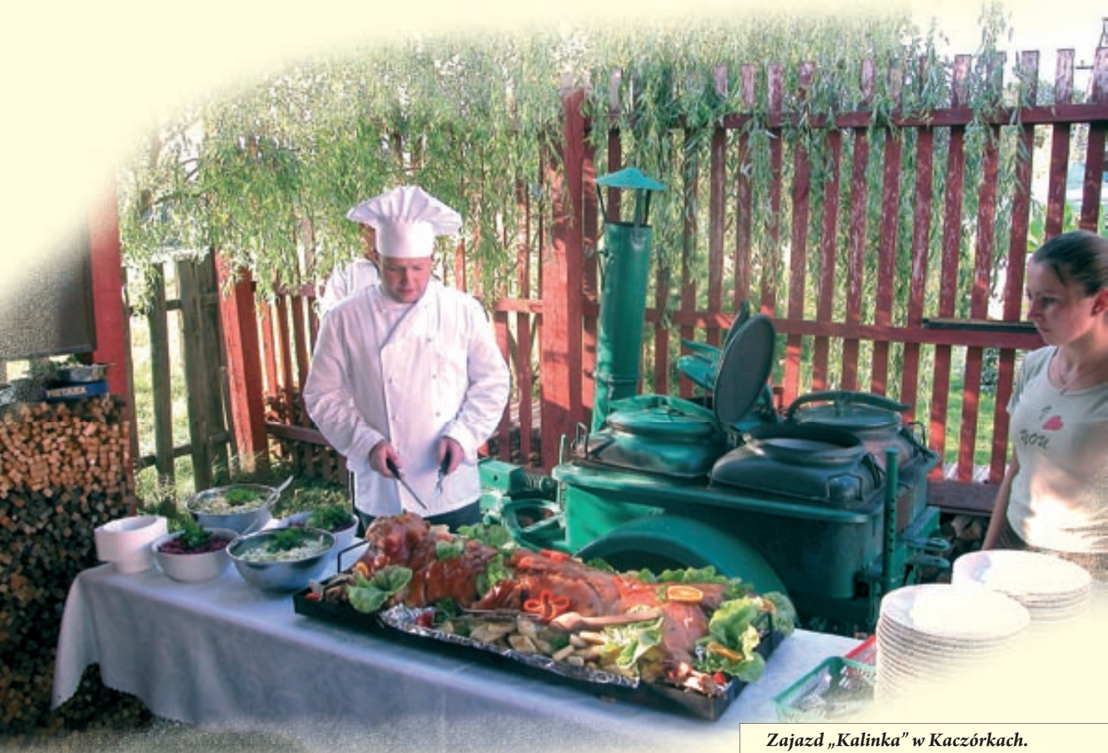
Zajazd „Kalinka” w Kaczórkach.

Roztoczańskie karczmy, restauracje i domowe jadłodajnie preferują kuchnię tradycyjną i lokalną. Można również zaopatrzyć się u gospodarzy w chleb domowego wypieku, tradycyjnie wytwarzane masło, świeżo uwędzone pastragi i słynny roztoczański miód prosto z pasieki.