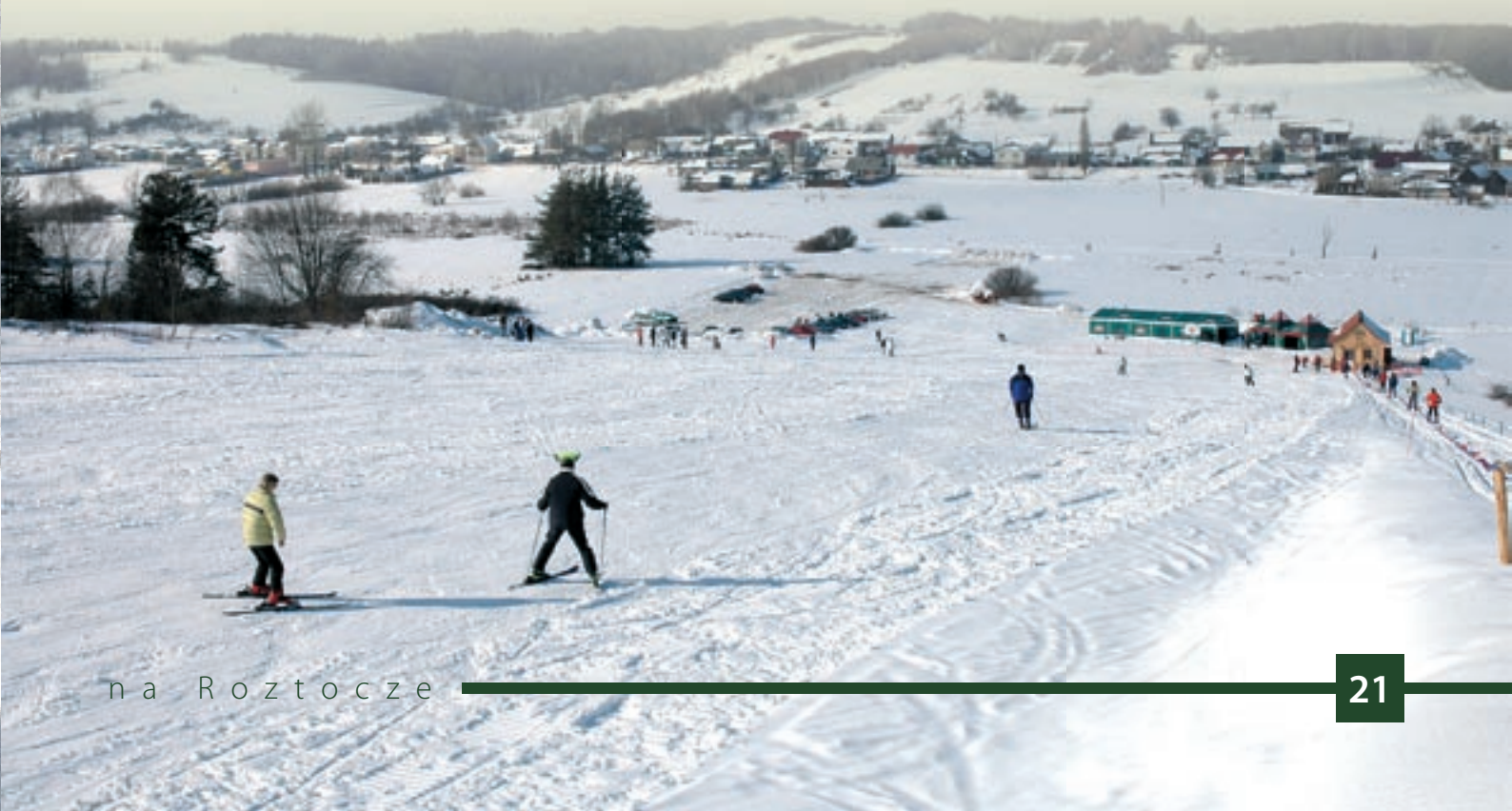
Stok narciarski i panorama Jacni.