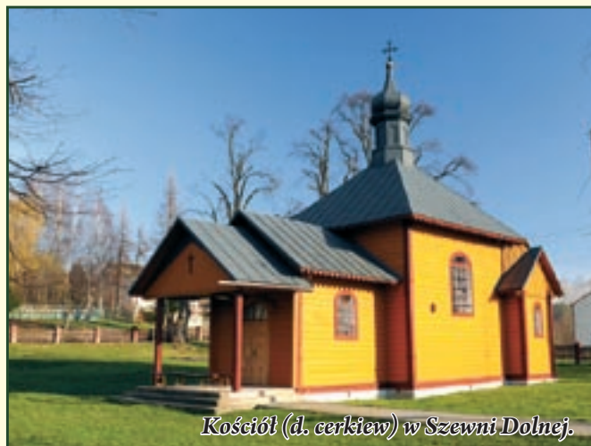
Kościół (d. cerkiew) w Szewni Dolnej.

Ciekawe zbiory posiadają muzea i izby pamięci. W więk-szości z nich, m.in. w Guciowie, Górecku Kościelnym, Krasnobrodzie, Wysokiem k. Zamościa i Zwierzyńcu przy ZOKiR, dominują zbiory etnograficzne. Mu-zeum w Bondyrzu poświęcone jest przede wszystkim II wojnie światowej, Muzeum Sakralne w Krasnobro-dzie – historii sanktuarium NMP, a ekspozycja Ośrod-ka Edukacyjno-Muzealnego Roztoczańskiego Parku Narodowego – przyrodzie parku i Roztocza.