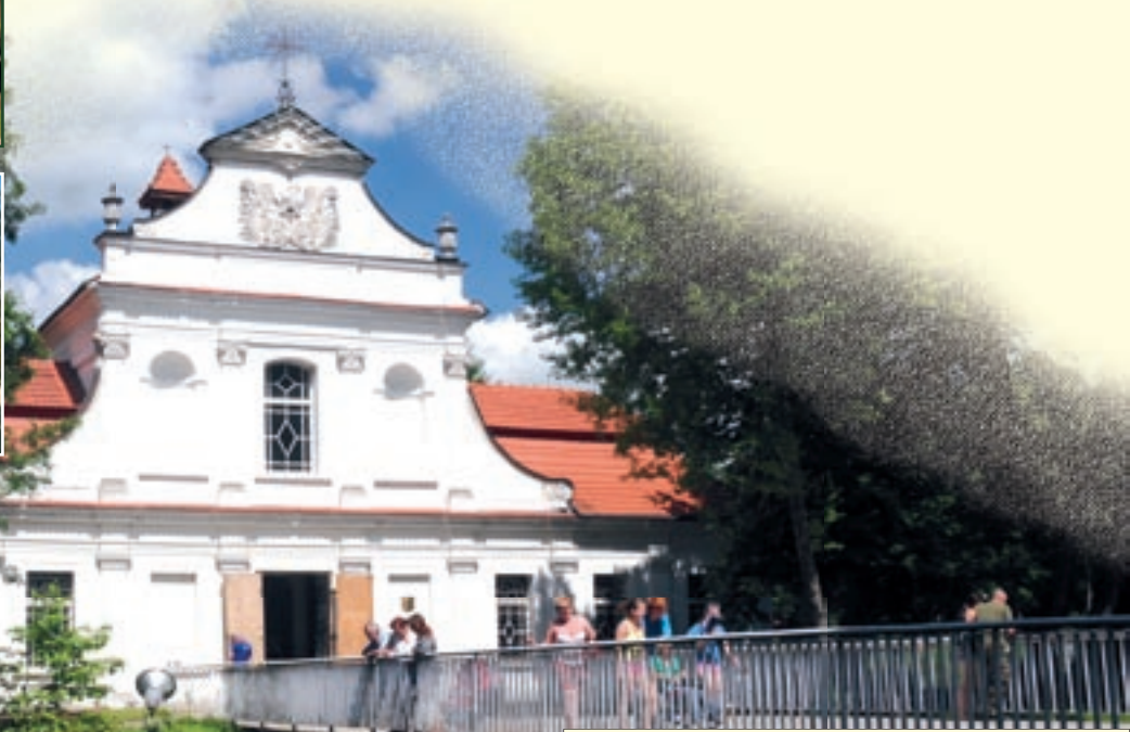
Kościół „Na wodzie” w Zwierzyńcu.