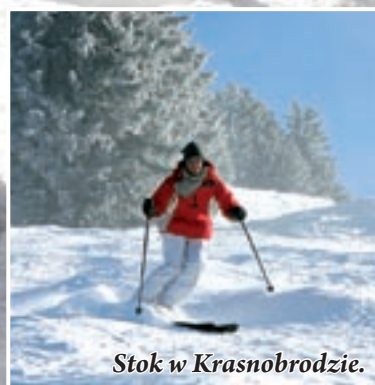
Stok w Krasnobrodzie.