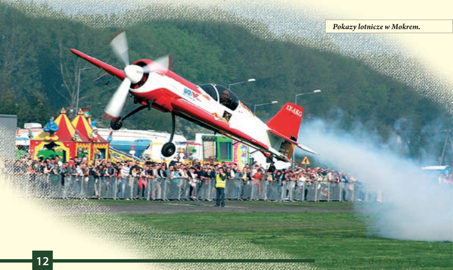
Pokazy lotnicze w Mokrem.

Od ponad 30 lat w krasnobrodzkim sanktuarium organizowane są Letnie Międzynarodowe Koncerty Organowe. W czasie wakacji w niedzielne popołudnia w kościele rozbrzmiewa muzyka różnych epok, od renesansu po współczesność, a jej wykonawcami są organiści z całego świata. Od kilku lat w obu krasnobrodzkich kościołach odbywa się Międzynarodowy Festiwal Muzyki Organowej i Kameralnej „PER ARTE AD ASTRA”.