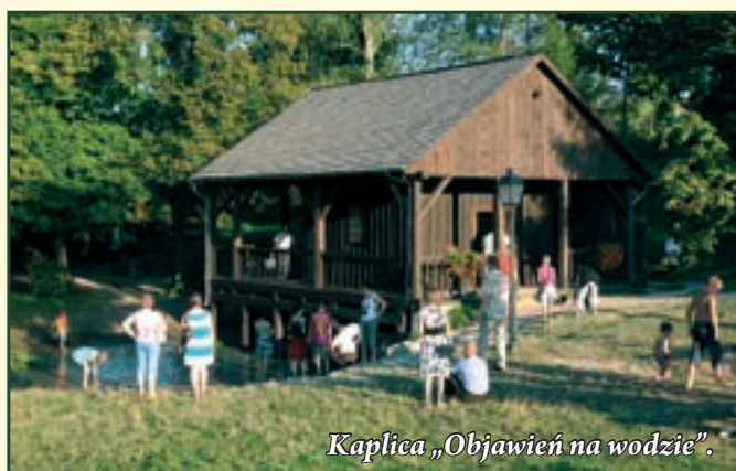
Kaplica „Objawień na wodzie”.

W wyniku tych badań w 2002 roku Krasnobród uzyskał status uzdrowiska.