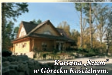
Karczma „Szum” w Górecku Kościelnym.