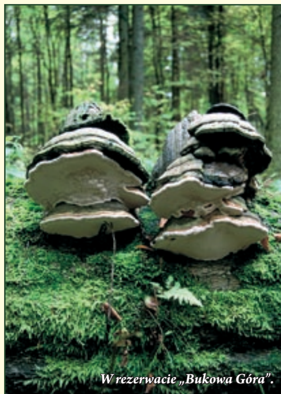
W rezerwacie „Bukowa Góra”.

Latem, ku ucieście wczasowiczów, lasy Rostocza wypełniają się malinami, poziomkami, jagodami i grzybami.