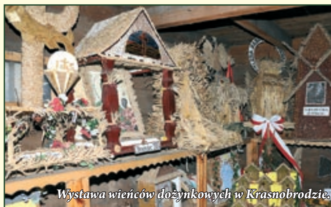
Wystawa wieńców dożynkowych w Krasnobrodzie.