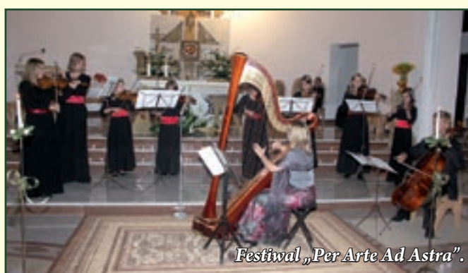
Festiwal „Per Arte Ad Astra”.