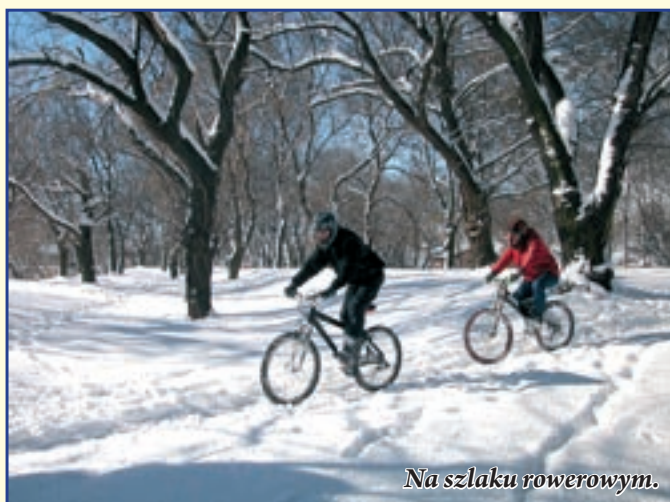
Na szlaku rowerowym.