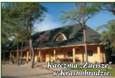
Karczma „Zacisze” w Krasnobrodzie.

Ułatwia to dobra i dostosowana do różnych oczekiwań baza noclegowa. Są tu hotele, pensjonaty, kwatery agroturystyczne, ośrodki wypoczynkowe, szkoleniowe i campingi o zróżnicowanym standardzie i cenie. Coraz popularniejszą formą jest wynajmowanie domów letniskowych. Zdarza się, że domy te wynajmowane są na kilka miesięcy przez osoby, które chcą na dłużej zatrzymać się na Roztoczu. Najwięcej miejsc noclegowych jest w Krasnobrodzie i Zwierzyńcu.