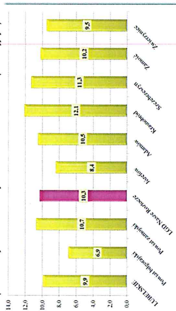
Wykres Wskaźnik bezrobocia na obszarze LGD „Nasze Roztocze” (udział liczby osób bezrobotnych w liczbie ludności w wieku produkcyjnym)