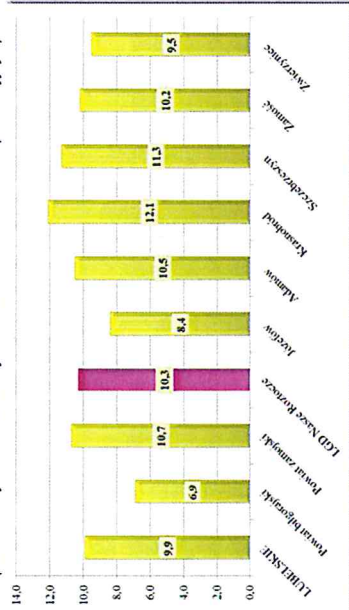
Wykres Wskaźnik bezrobocia na obszarze LGD „Nasze Roztocze” (udział liczby osób bezrobotnych w liczbie ludności w wieku produkcyjnym)